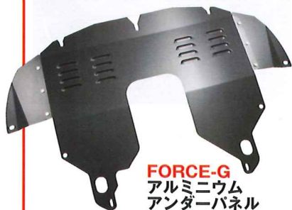
FORCE-G アルミニウム アンダーパネル

純正比で最低地上高をプラス約3cm確保するアルミ製アンダーパネル。多くのユーザーが体験する、荒れた路面や段差での不快なヒートを低減するうえ、エアインレットを設けることでエンジンルームへフレッシュエアを取り込み、冷却にも大きな効果を発揮する。3ピース構造で、装着はボルトオン。147、156、GT用 ¥71,400