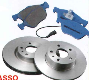
ASSO ストリートパッド&ローター

ドイツ・Zimmermann社の協力で完成した、純正よりも低価格で、純正以上の効果を発揮するブレーキローター。ブレーキパッドも純正比約10%の効力アップを図りながらダストを約20%軽減させており、使用温度領域も0~450℃と幅広く使えるストリート仕様になっている。各車種用ローター ¥12,600~、パッド ¥15,750~