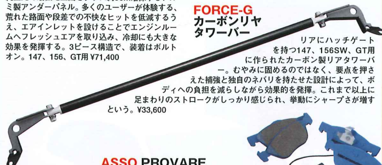
FORCE-G カーボンリヤ タワーバー

リアにハッチゲートを持つ147、156SW、GT用で作られたカーボン製リアタワーバー。むやみに固めるのではなく、要点を押さえた補強と独自のネバリを持たせた設計によって、ボディへの負担を減らしながら効果を発揮。これまで以上に足まわりのストロークがしっかり感じられ、挙動にシャープさが増すという。¥33,600